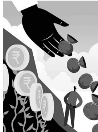
ILLUSTRATION: BINAY SINHA

Total inflows into equity schemes was ₹1.35 trillion for the 11-month period ended February 2022. Equity NFOs mopped up ₹45,344 crore during this period. Meanwhile, SIPs registered net inflows of ₹1.12 trillion. In the past four months, SIP inflows have been more than ₹11,000 crore